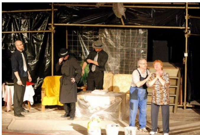
DS Timrava Lučenec – Štyri ročné obdobia

Boli udelené aj ocenenia – Cena Národného osvetového centra – Pocta generálneho riaditeľa NOC divadelnému súboru Timrava pri príležitosti 65. výročia vzniku. Zároveň Blahoželanie NOS v Lučenci DS Timrava a DS Opona