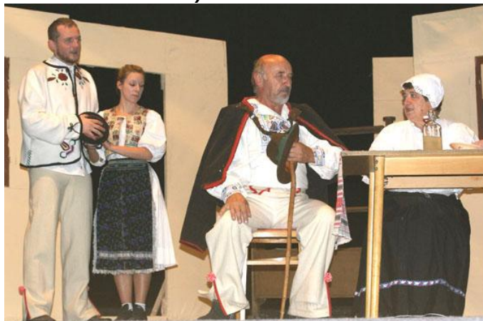
OZ Opona Poltár – Ženský zákon

v Poltári pri príležitosti 30. výročia založenia. Všetko sa to dialo celkom na 7 javiskách v regióne, kde sa hrali divadelné predstavenia, najviac pochopiteľne v Lučenci, v Dome kultúry B.S. Timravy a v CVČ Magnet, ale hralo sa aj vo Filákovce, Radzovciach, Poltári, Kokave nad Rimavicou a Budinej. Zároveň naše 3 div. súbory vystúpili v susednom Maďarsku, kde odohrali celkom 7 predstavení.