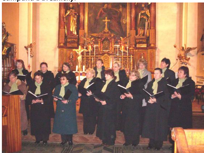
Ženský spevácky zbor Jazmín z Radzoviec

Regionálnu prehliadku cirkevných a svetských speváckych zborov pod názvom „Adventné stretnutie“ usporiadali organizátori v sobotu 4.12.2010 o 15.00 hod. v rímsko-katolíckom kostole Navštívenia Panny Márie v Lučenci. Zúčastnili sa jej 3 spevácke zbory: ženský spevácky zbor Melódia z Fiľakova, ženský spevácky zbor Jazmín z Radzoviec a chrámový zbor Campana z Brezničky. Štvrtý ročník podujatia sa vydaril a spokojní môžu byť aj organizátori: BBSK – Novohradské osvetové stredisko v Lučenci, Rímsko-katolícka cirkev, farnosť Lučenec a Chrámový spevácky zbor Campana z Brezničky.