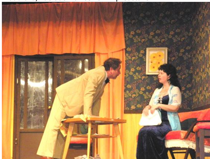
Divadlo J. Kármána Lučenec – Bláznivá nedeľa

v Poltári pri príležitosti 30. výročia založenia. Všetko sa to dialo celkom na 7 javiskách v regióne, kde sa hrali divadelné predstavenia, najviac pochopiteľne v Lučenci, v Dome kultúry B.S. Timravy a v CVČ Magnet, ale hralo sa aj vo Filákovce, Radzovciach, Poltári, Kokave nad Rimavicou a Budinej. Zároveň naše 3 div. súbory vystúpili v susednom Maďarsku, kde odohrali celkom 7 predstavení.