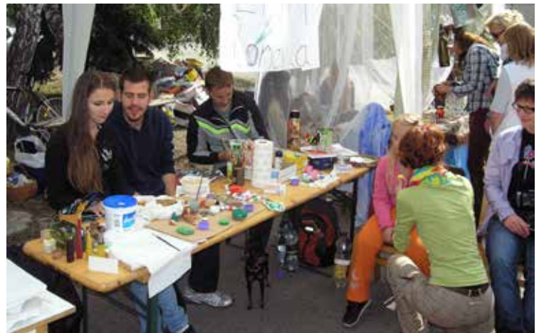
Svoj stánok mali mladí umelci – Stom života Borievka.