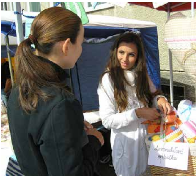
Levandulové srdiečka mali na jarmoku úspech.