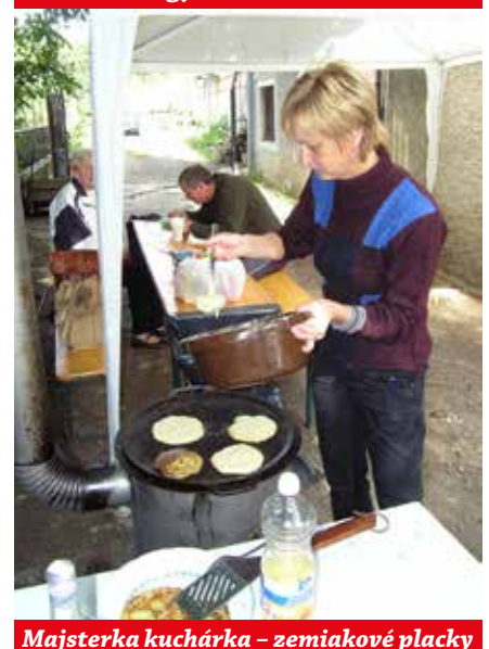
Majsterka kuchárka – zemiakové placky chutili ...