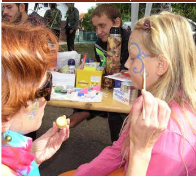
Počas jarmoku sa maľovalo aj na detské tváričky

Takmer do roka a do dňa sa obyvatelia našej obce opäť stretli, tentokrát na IV. ročníku Vidinského remeselného jarmoku, ktorý organizačne zabezpečovali: Občianske združenie KROP vo Vidinej v spolupráci s Miestnym odborom Matice Slovenskej a Obcou Vidiná.