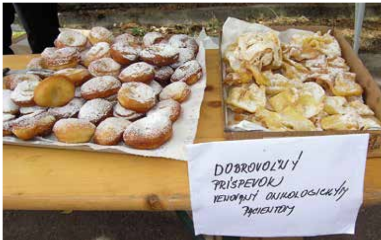
Dobrovoľnou zbierkou sa prispelo onkologickým pacientom.